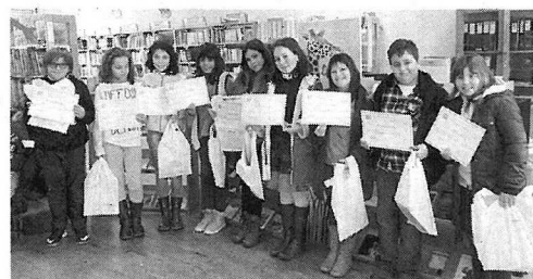
Vencedores mostram os diplomas da iniciativa

A semelhança da prova escrita, a prova oral incidiu sobre os contos "Os Cisnes Selvagens" e "O Patinho Feio", ambos de Hans Christian Andersen, e incluiu ainda algumas perguntas de incentivo à ima-