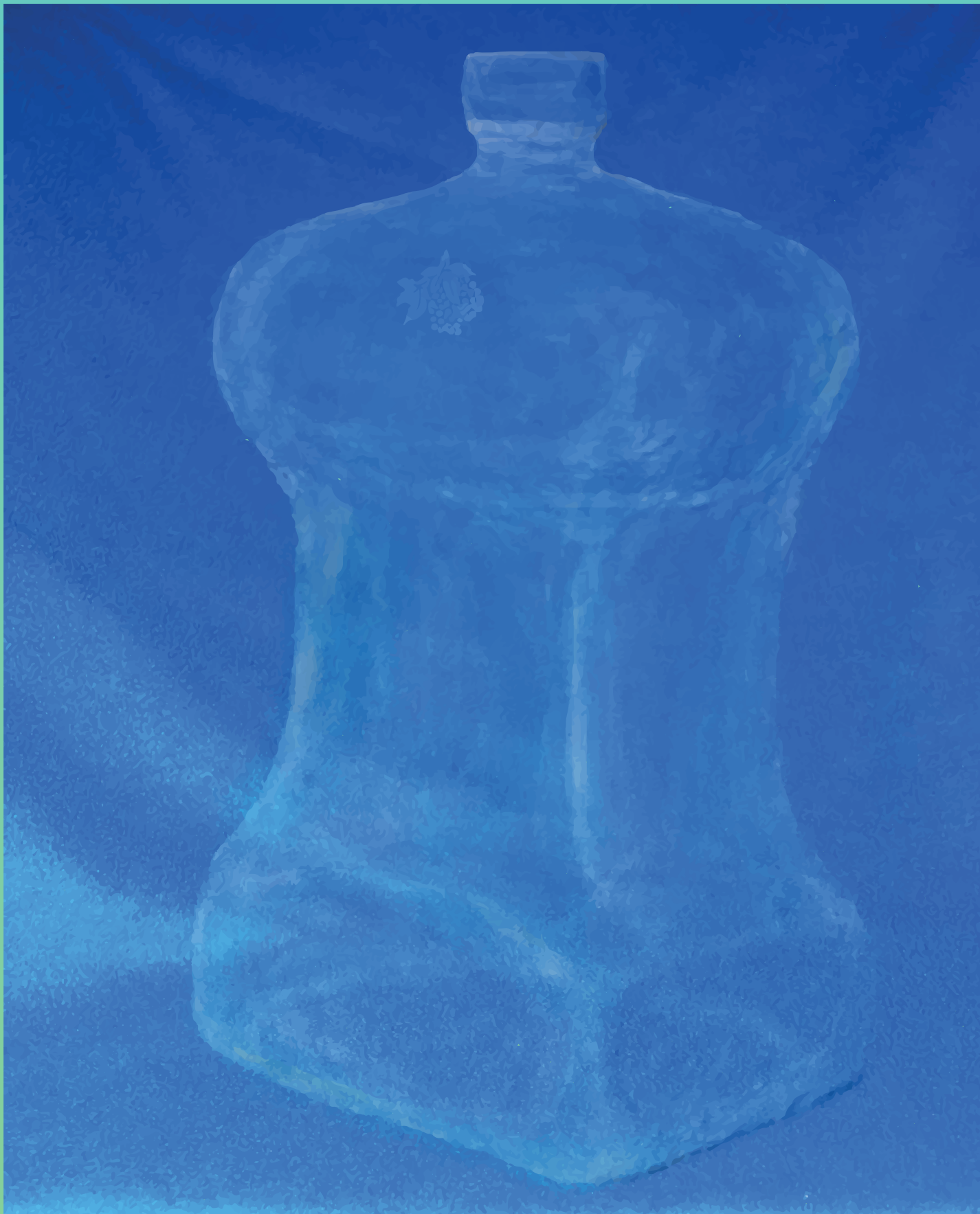
CONCURSO DE DESIGN & CRIATIVIDADE VERALLIA 2014 Vinho Garrafino