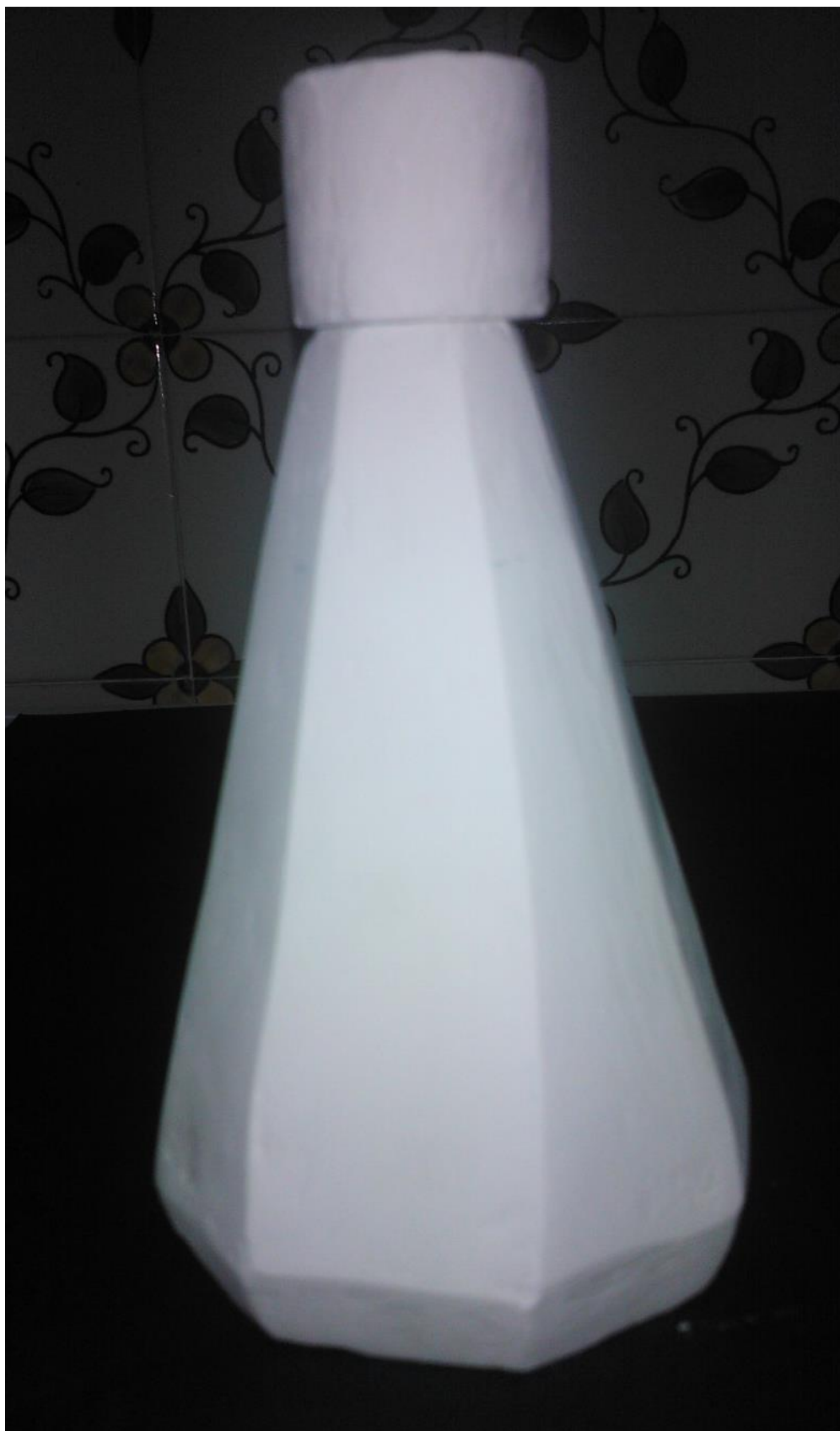
Categoria: Azeites Produto: "Diamond"