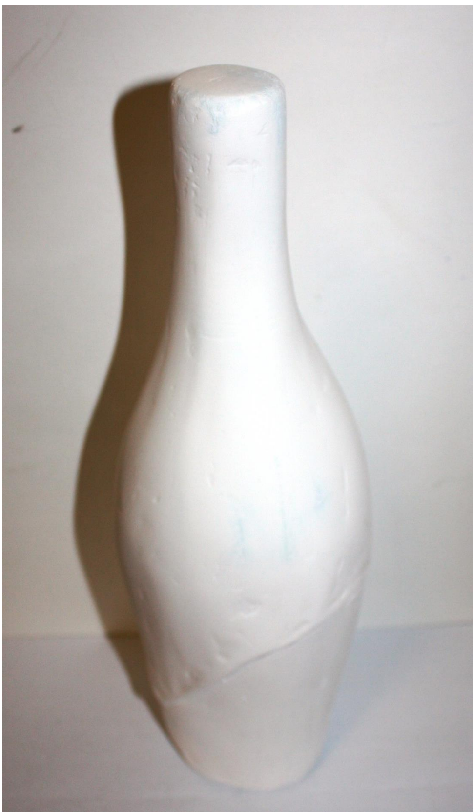
CONCURSO DE DESIGN & CRIATIVIDADE VERALLIA 2014 Categoria Frascos e Boiões Projeto "Ampulheta"