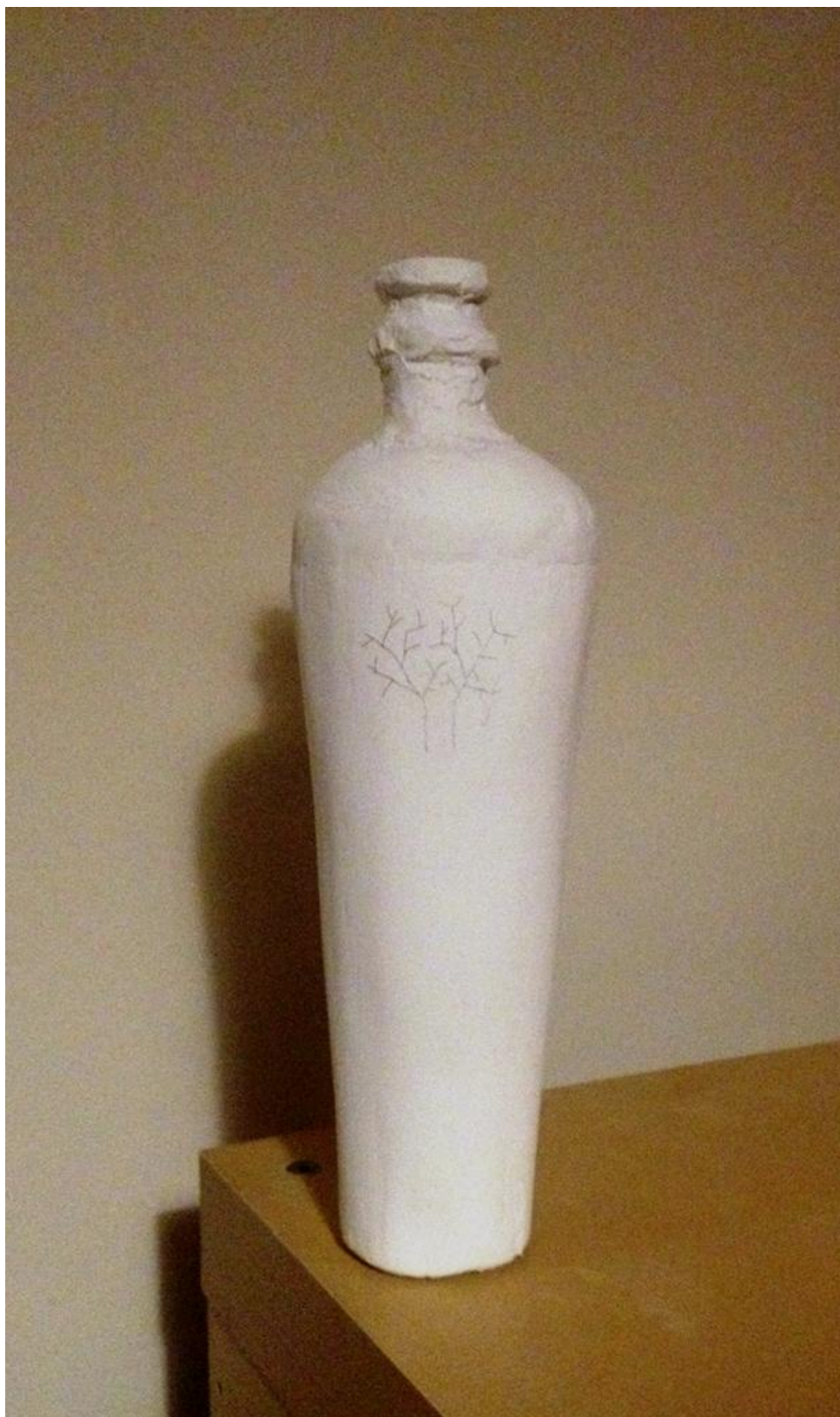
CONCURSO DE DESIGN E CRIATIVIDADE VERALLIA Categoria água “Natura”