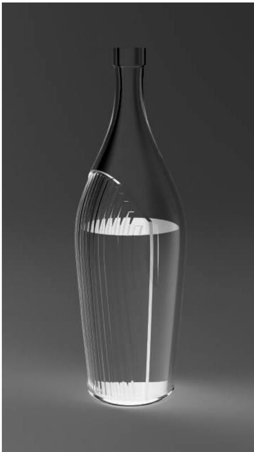
IMAGEM DO PRODUTO 3