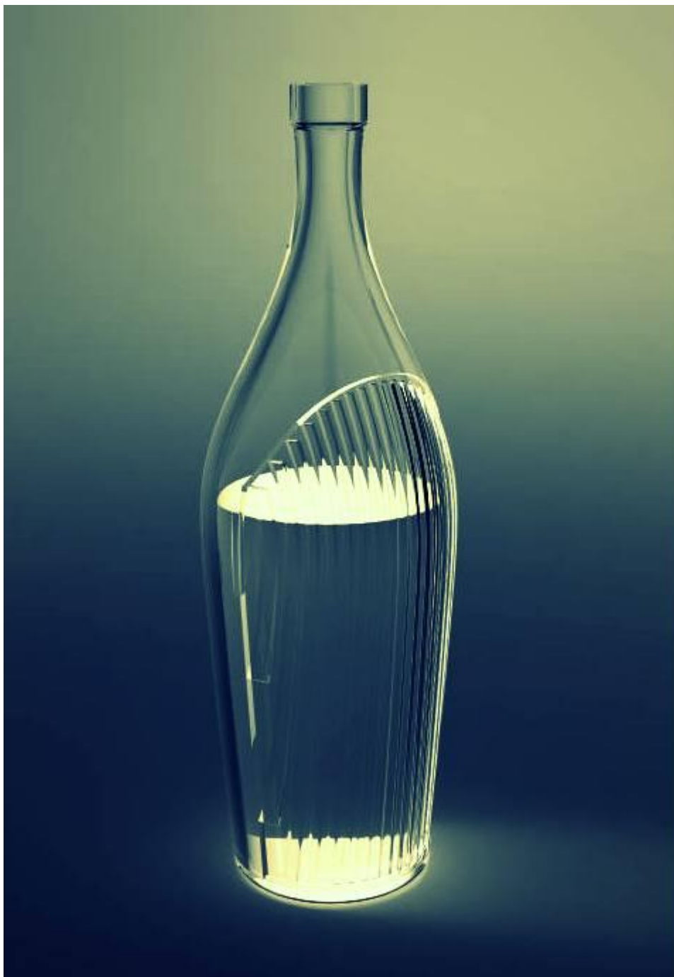
IMAGEM DO PRODUTO 1

CONCURSO DE DESIGN & CRIATIVIDADE VERALLIA 2014 Projeto "Tide Line" Dossier