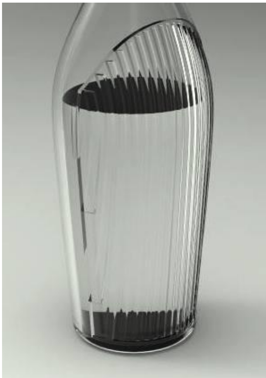
IMAGEM DO PRODUTO 2 (PORMENOR/LINHAS)

CONCURSO DE DESIGN & CRIATIVIDADE VERALLIA 2014 Projeto "Tide Line" Dossier