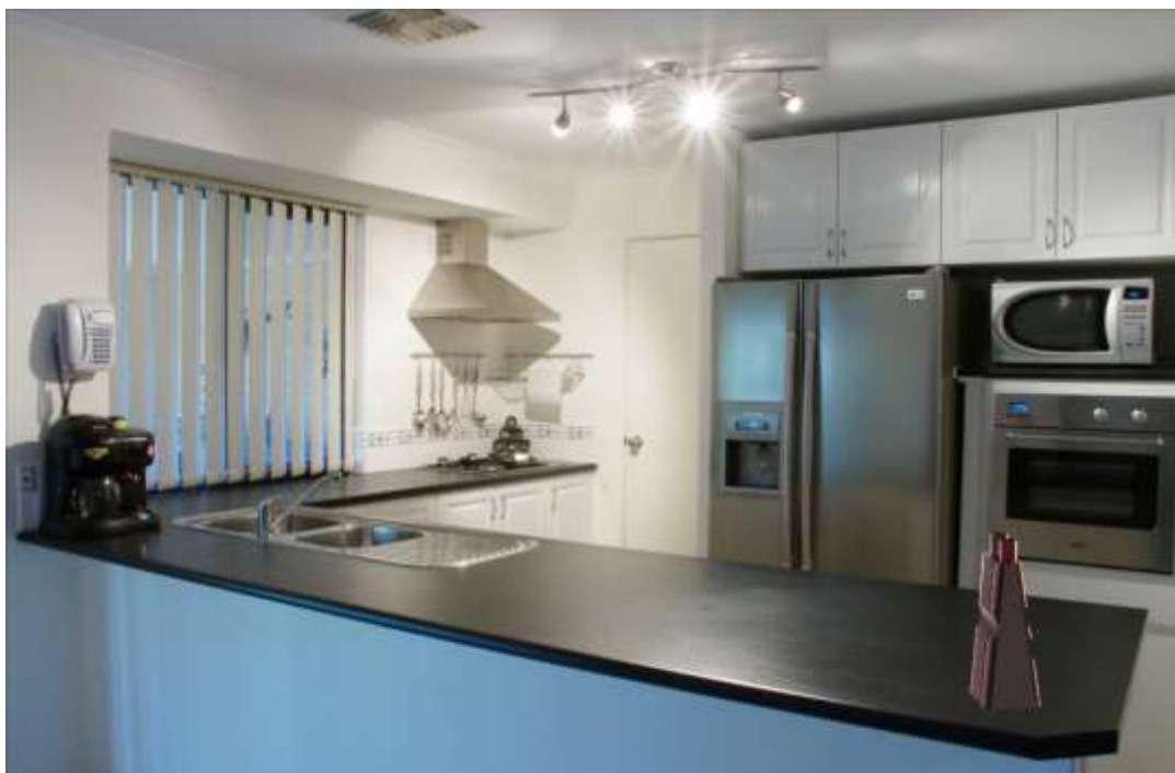
Imagem do projeto 3 - Produto em contexto de uso