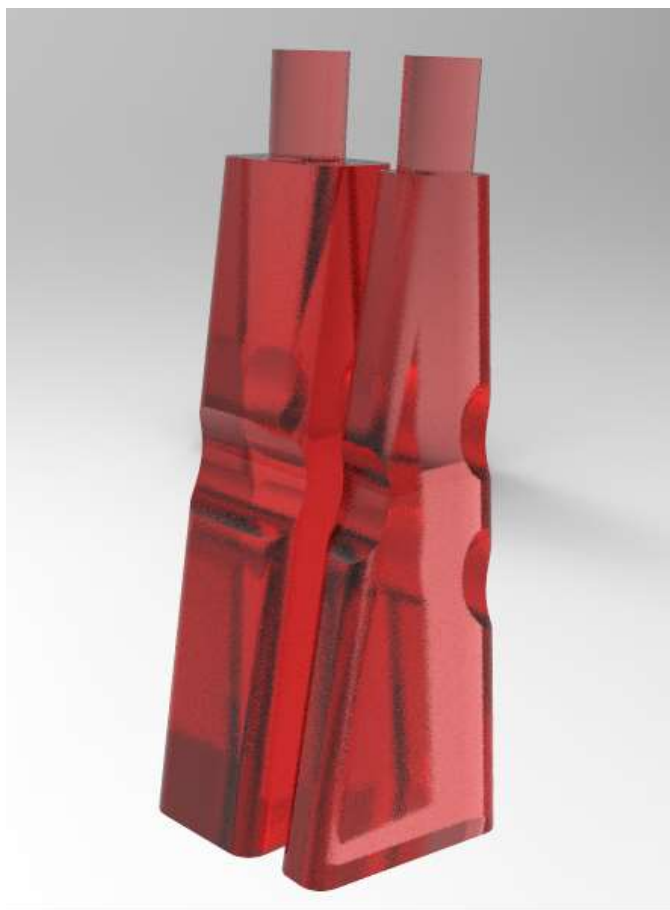
Imagem do projeto 4 – Pormenor do produto