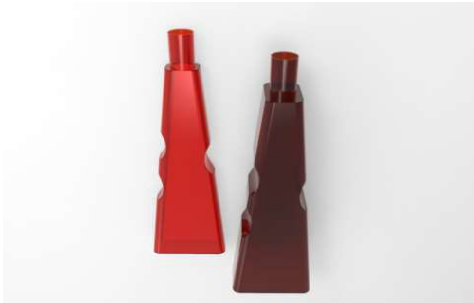
Imagem do projeto 2 – Produto em interação com o utilizador