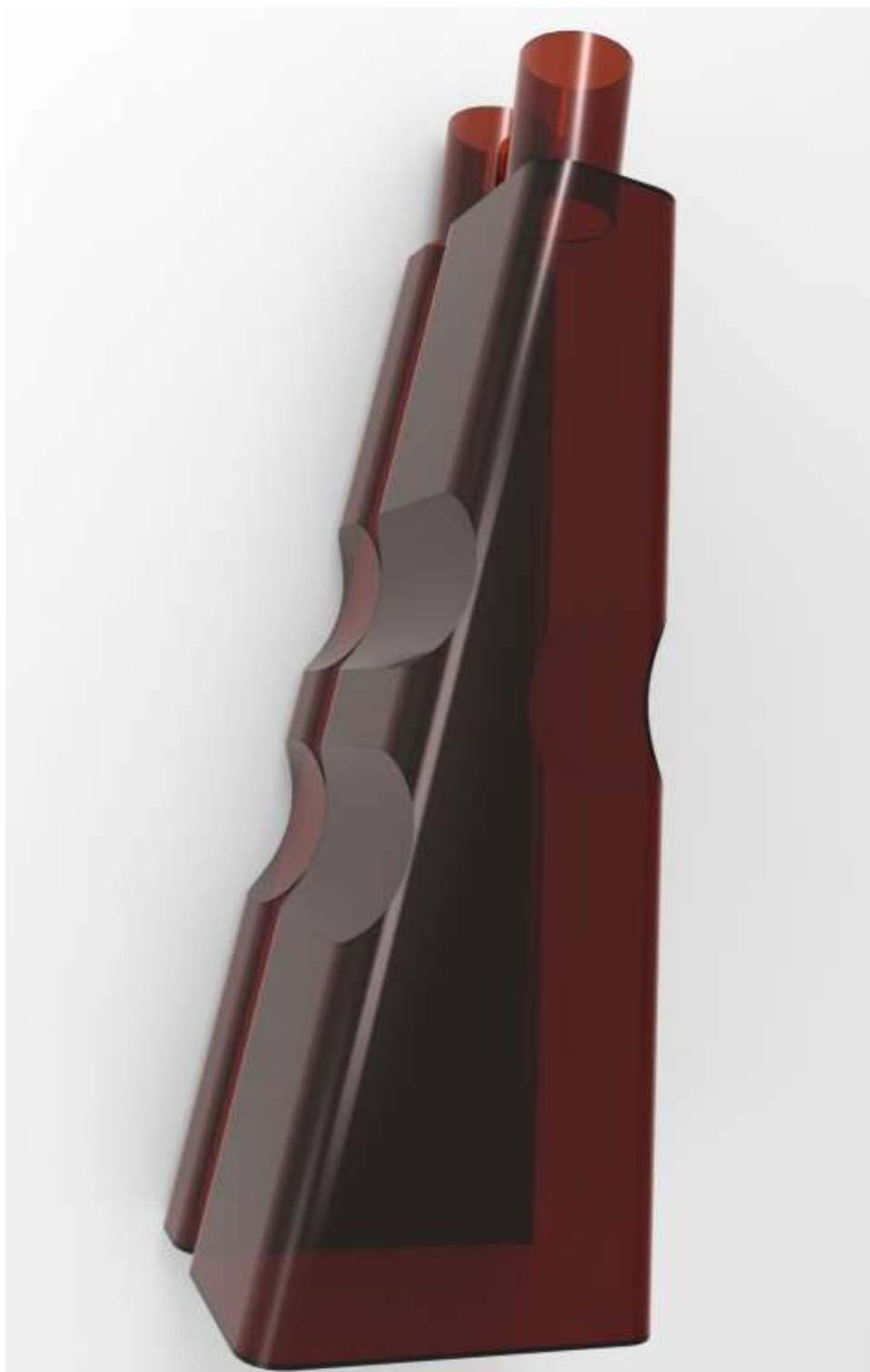
Imagem do produto 1