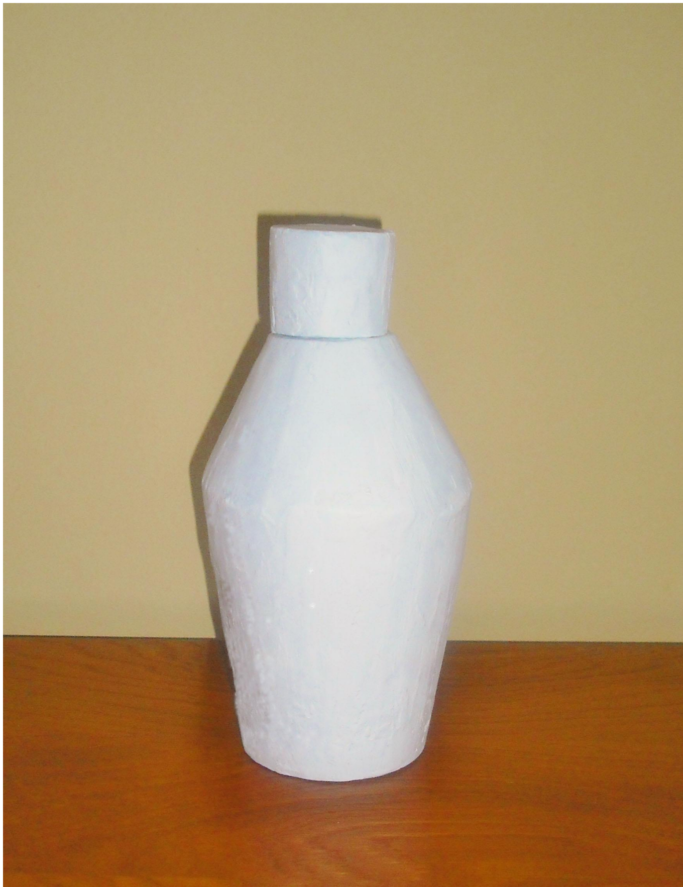
CONCURSO DE DESIGN & CRIATIVIDADE VERALLIA 2014 Categoria Aguardentes Projeto "Círculo"