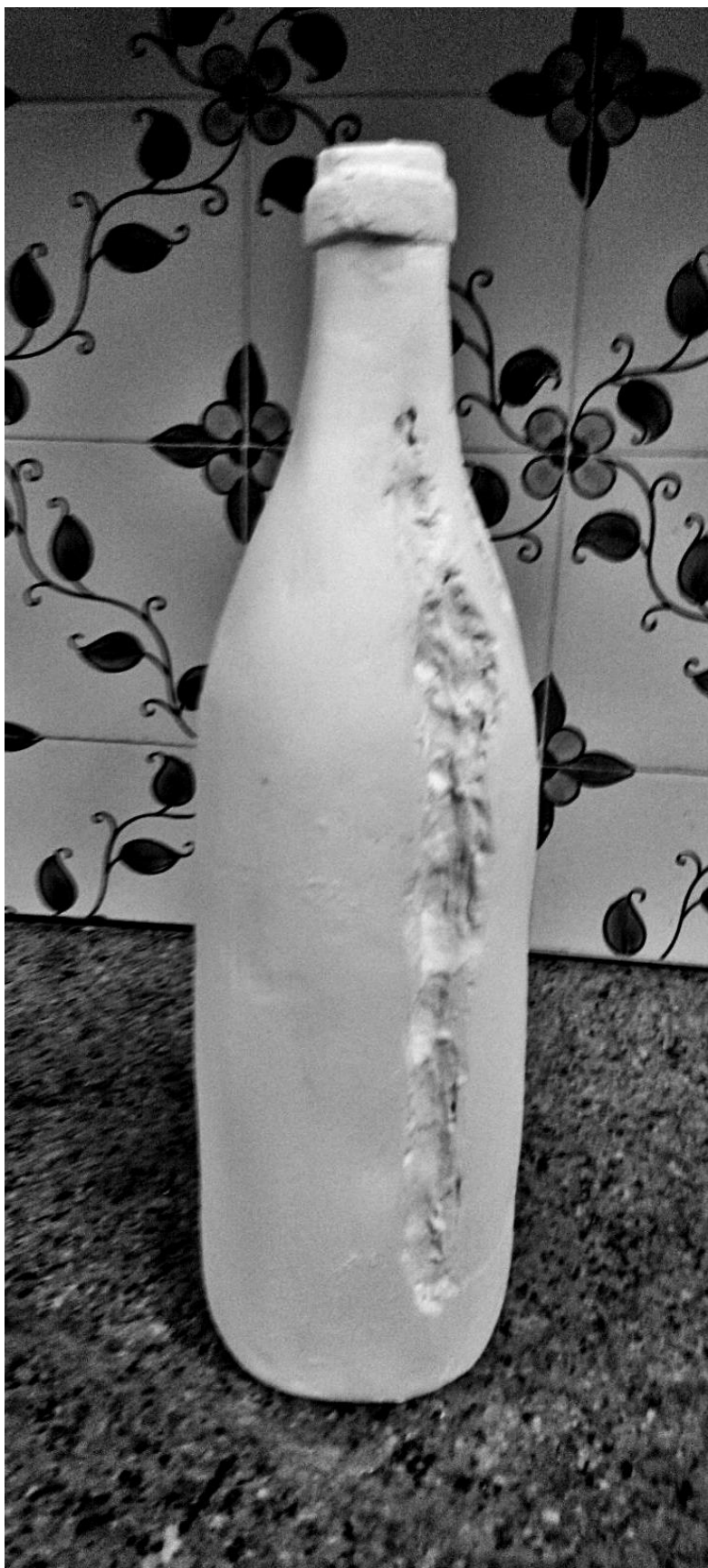
Categoria: Licores e Aguardente Produto: "Desire"