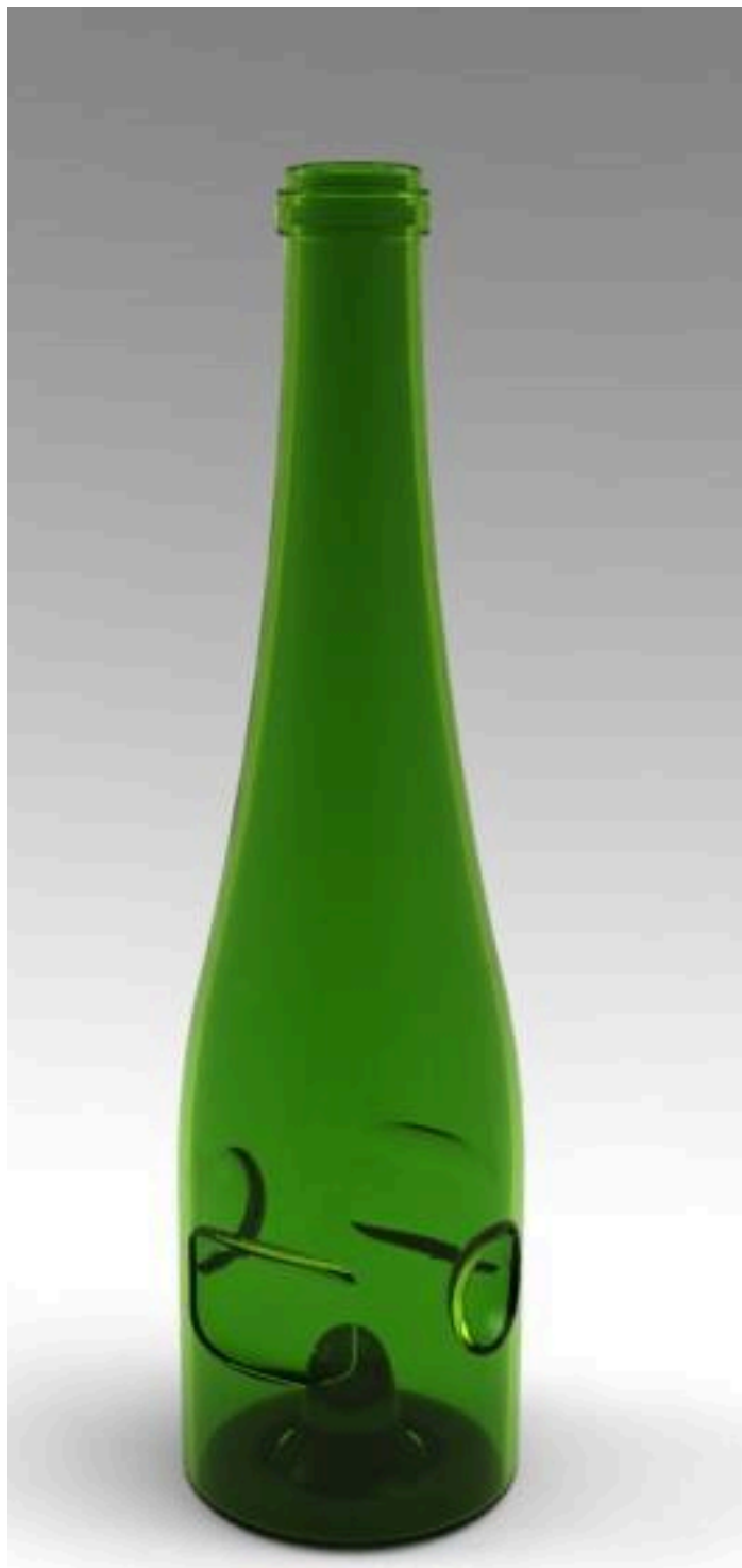
CONCURSO DE DESIGN & CRIATIVIDADE VERALLIA 2014 Categoria Vinhos Projeto "Copulare"