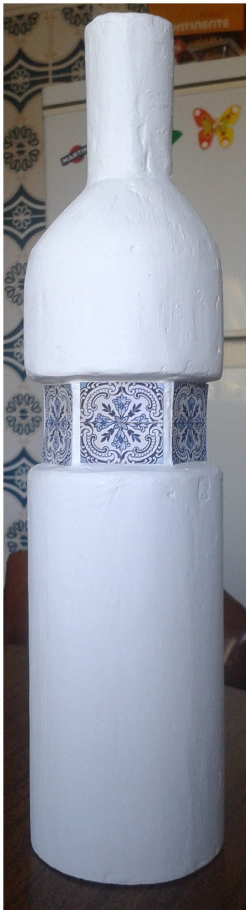
CONCURSO DE DESIGN & CRIATIVIDADE VERALLIA 2014 Categoria Azeite Projeto "Lusitana"