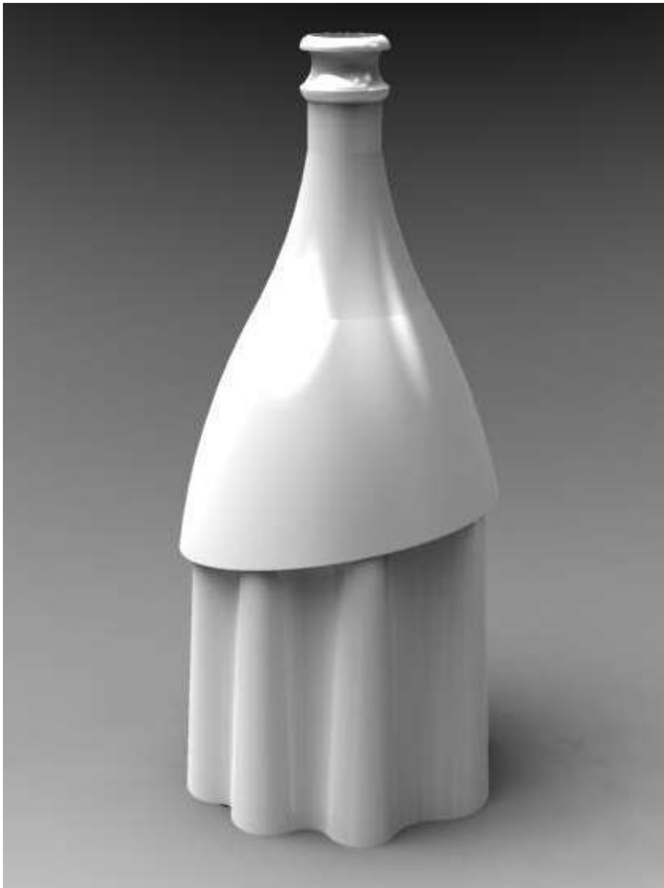
CONCURSO DE DESIGN & CRIATIVIDADE VERALLIA 2014 Categoria Espumantes Garrafa "Sponsa"